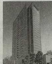
⑩ 武蔵小杉駅前事務所