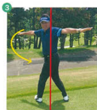
3 次に左後方に同様に身体をひねります。目線をチェックしておきます。私は右後方がひねりにくく右腰あたりにひっかかる違和感があり、左後方はかなりスムーズに動きました。