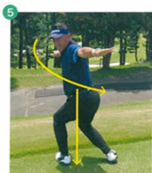
5 左おしり(股関節後方)に力を入れながら少し下に沈むようにストレッチします。この時、息は強く吐いてください。この動きを5回程度繰り返します。