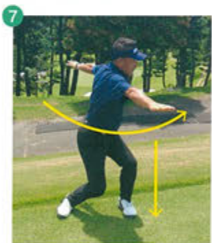
6 7 は前方からの映像です。5回程度このストレッチをした後、再び1~2の右後方への身体のひねりをしてみてください。最初よりも右後方への動きがスムーズになっているのが実感できるはずです。

★スムーズに動く方向へストレッチすることで動きにくかった方向が緩んで動くようになる、何かちょっと不思議とも思える身体の矯正方法です。是非お試しを!