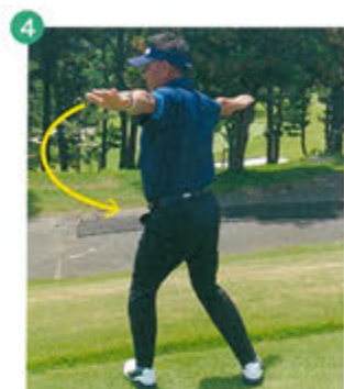
4 動きがスムーズだった左後方に身体をひねりながら