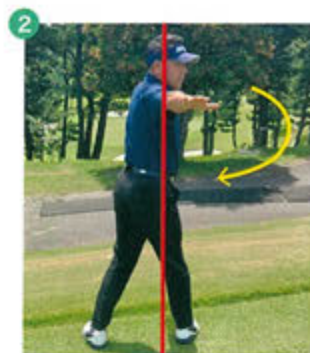
2 右後方に無理をせずに回れる所まで身体をひねります。後方のどのあたりまで目線がいくかチェックしておきます。