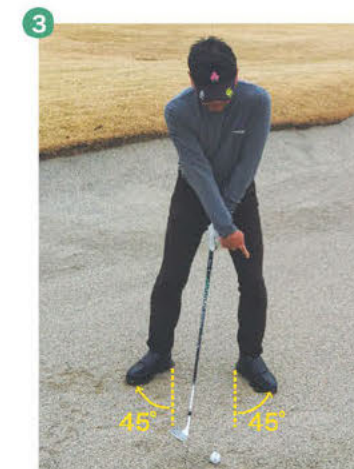
3 右足に加え、左足つま先も45°ほど外側に開きます。