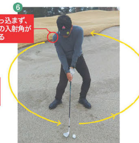
6 身体の重心位置が低く、かかと側にあるため、スイングは横長の楕円を描くイメージとなり、インパクトへの入射角はかなり鈍角となります。

★鈍角の入射角からスイングされたボールは打ち出角が高く、着地してすぐ止まるほどのスピッシュットになります。ボールが高く打ち上がるので、距離以上に大きな振り幅のスイングを心がけてください。