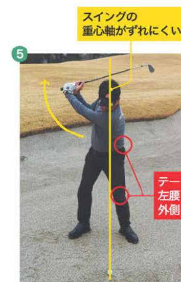
5 左足つま先を開いているため、テークバックは左腰・左ひざが外側に引っ張られながら巻き上がり、スイングの重心軸がずれにくくなります。