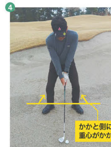
4 両足のつま先を外側に開いたため、重心の位置はかかと側になり、身体の重心もかなり低くなります。